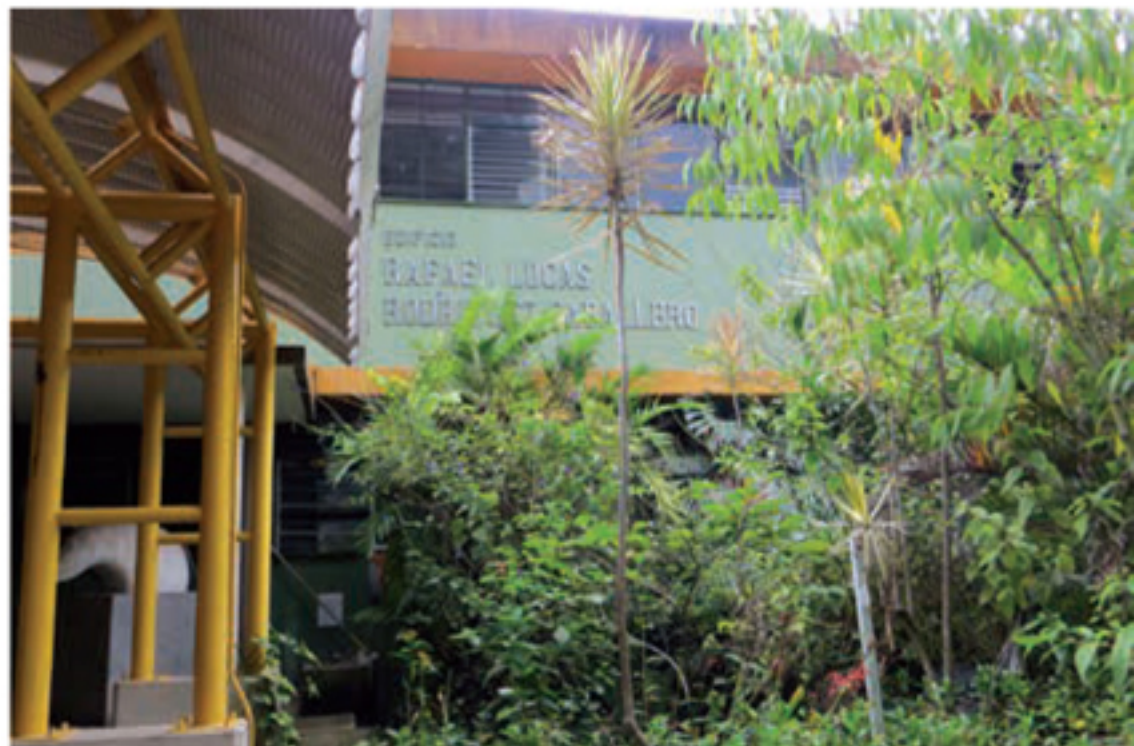
Entrada principal del edificio de la Escuela de Biología de la UCR, que luce el nombre de Rafael Lucas. Arriba: como se veía en el 2009. Abajo: ahora hay un techito que cubre los senderos que dan acceso a la entrada, de modo que se cambió la ubicación de las letras.